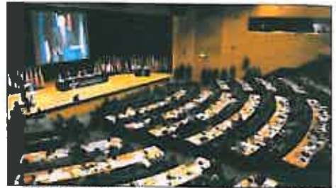
En 2009 creció el impacto económico por la mayor asistencia.

las tendencias para este año en el mercado de viajes de negocios. Así, se prevé "un importante" descenso de las tarifas de hotel negociadas, precios medios de billetes superiores para los viajes en avión mientras continúa la consolidación del sector aéreo, fees adicionales, mayor competencia de los viajes en tren, las empresas de renta car aumentarán los cargos de no-show y se fomentarán los servicios móviles para los viajeros. Panorama / Pág. 5