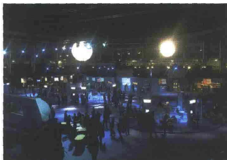
Un momento di una convention organizzata da CWT Meetings &amp; Events.